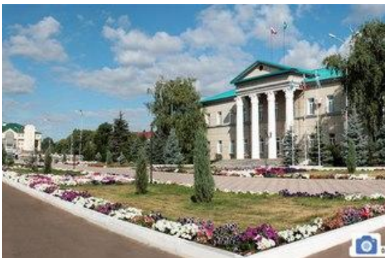
Муниципальный район Мелеузовский район Республики Башкортостан